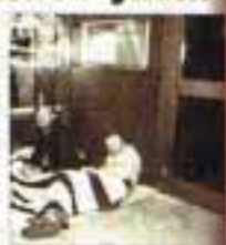
Banka binasında kamp

Avrupa'da uyuşturucu yıkımı. Hainberg'in bir yıl önce ölümlerinde sığınan süper güçler uyuşturucu abartıları 90 kişi oldu.